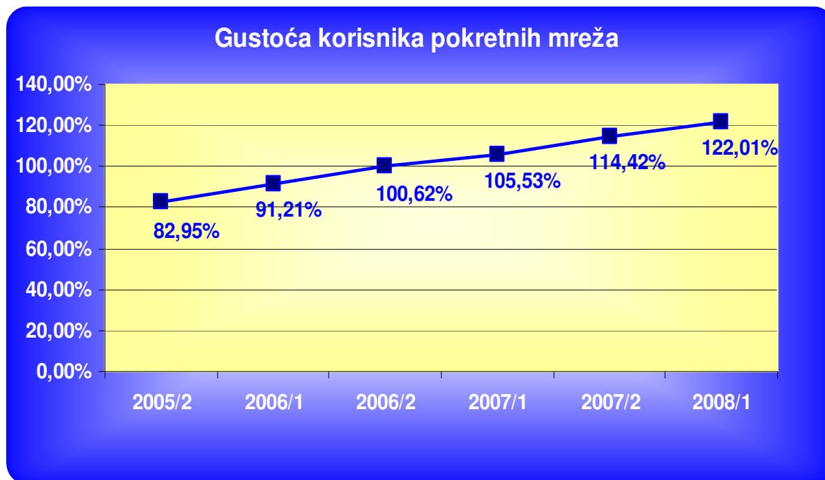
Slika 3. Gustoća korisnika pokretnih mreža